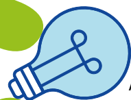
LAMPADINE A FLUORESCENZA