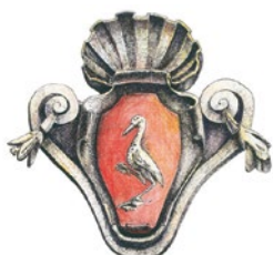
Città di Grugliasco

Domenica 20 ottobre si terrà la presentazione del 4° volume della collana libraria "Grugliasco - Appunti per una sua storia", edito da Arti Grafiche San Rocco. Il programma prevede alle 10 la Messa nella chiesa parrocchiale di San Cassiano in ricordo del