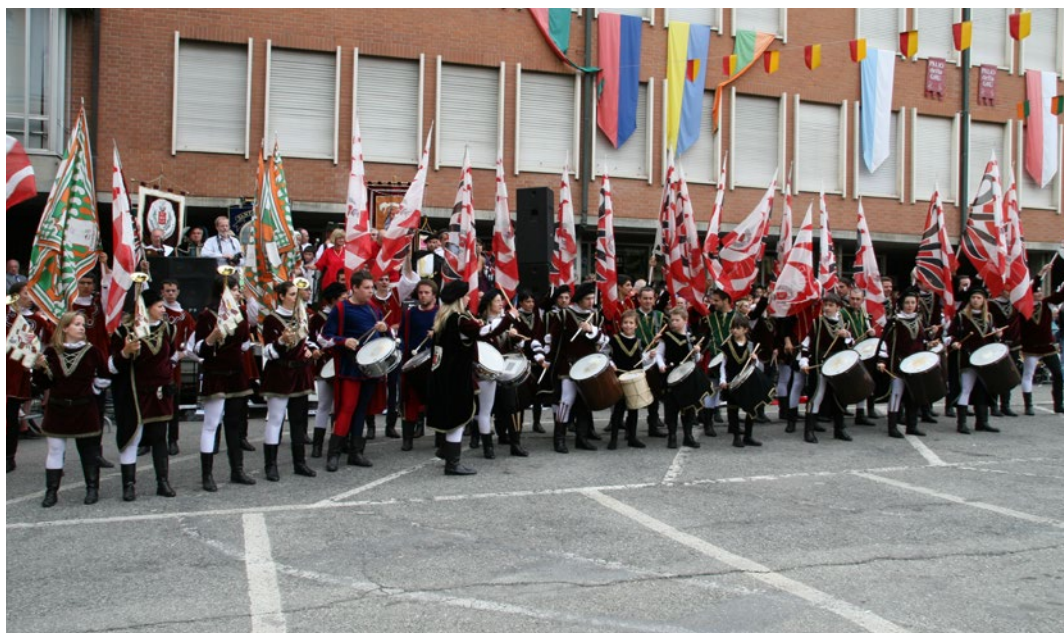
Il 2 giugno Grugliasco festeggia la 30° edizione del Palio della Gru